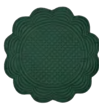
MANTEL INDIVIDUAL REDONDO Ø 38 cm Ref: 5428619 72/864 4,00€