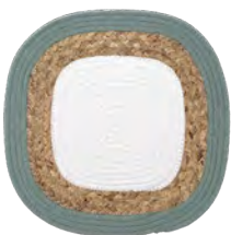
MANTEL INDIVIDUAL CUADRADO 38x38 cm Ref: 5428617 48/864 5,25€