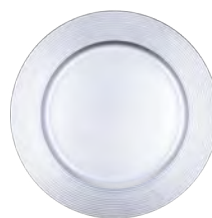
BAJO PLATO 33 cm Ref: 5428122 12/1080 1,65€