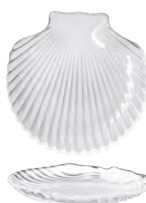
VIEIRA 14x13,8 cm Ref: 5427478 36/3024 M: 140x138 mm 2,10€