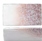
TRONCO RECTANGULAR 21x12 cm Ref: 5429570 16/ M: 210x120 mm 13,50€