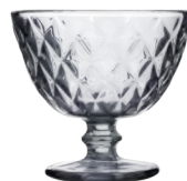
COPA HELADO 34 cl Ref: 5428317 24/384 M: Ø 110 mm H: 102 mm P: 350 gr 2,10€