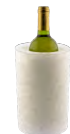
COOLER ENFRIADOR ULTRA RÁPIDO 13x21,8 cm Ref: 8044479 6/ 22,90€