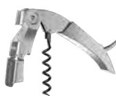
TITAN PREMIUM SACACORCHOS 13,5x12x3 cm Ref: 5428543 6/ 27,50€