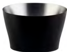
CUBITERA ACERO NEGRO 20 L Ref: 5429219 3/ 107,10€