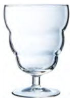
JOLLY C6 COPA HELADO 35 cl Ref: 5429708 Ref: AIF X2620 1/ M: Ø 92 mm H: 125 mm P: 204 gr 25,84€