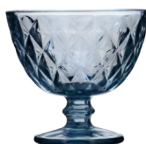
COPA HELADO 34 cl Ref: 5428318 24/384 M: Ø 110 mm H: 102 mm P: 350 gr 2,10€