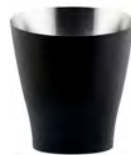
CUBITERA ACERO VINTAGE NEGRO 5 L Ref: 5429220 6/ 67,50€