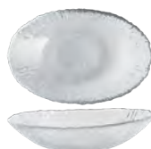
CUENCO OVALADO 27x18 cm Ref: 5428458 6/ M: 270x180 mm 6,80€