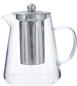
TETERA CON TAPA Y FILTRO INOX 95 cl Ref: 5428425 12/192 7,75€