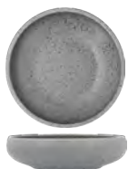
PETREA BOL PRESENTACIÓN 18x5 cm Ref: 5429556 24/ M: 180x50 mm 10,50€

“La porcelana que captura la esencia de la piedra para realzar la cocina de autor.” La colección Petrea está inspirada en la sobriedad, textura y naturalidad de la piedra. Su diseño aporta un equilibrio único entre robustez estética y elegancia minimalista, convirtiéndola en una propuesta ideal para restaurantes que buscan presentaciones modernas, limpias y de impacto visual.