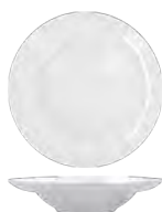
PLATO PASTA 27,5 cm Ref: 5428057 12/432 M: Ø 275 mm 3,60€