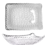
BANDEJA 12,5x9 cm Ref: 5427476 36/2592 M: 125x90 mm 1,90€