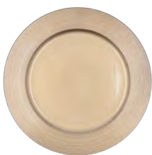
BAJO PLATO 33 cm Ref: 5428121 12/1080 1,65€