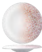
PLATO ALA 23,7x4,2 cm Ref: 5429565 24/ M: 237x42 mm 10,70€