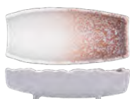
CUENCO CON PATAS 26x12 cm Ref: 5429564 24/ M: 260x120 mm 14,30€