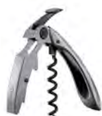
BIG TECH PREMIUM SACACORCHOS 12,8x18x3 cm Ref: 5428549 6/ 23,00€