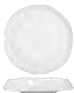
PUREZA ABSTRACTA PLATO DEGUSTACIÓN 20 cm Ref: 5429545 24/ M: Ø 200 mm 7,80€

Ideal para chefs que buscan impacto visual, diferenciación y una vajilla que acompañe creaciones de autor.