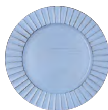
BAJO PLATO 33 cm Ref: 5428120 12/1080 1,90€