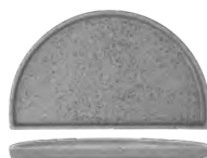
FUENTE LUNA 27x16 cm Ref: 5429560 24/ M: 270x160 mm 10,70€