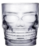
TIKICALA VASO 30 cl Ref: 5429251 24/ M: Ø 83 mm H: 93 mm P: 300 gr

Vasos inspirados en las esculturas y deidades polinesias (como moáis o dioses), que son elementos clave de la coctelería Tiki, un estilo nacido en EE. UU. en los años 30 que busca transportar a una experiencia tropical.