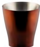
CUBITERA ACERO VINTAGE NATURAL 5 L Ref: 5429218 6/ 67,50€