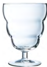
C6 COPA HELADO 45 cl Ref: 5429709 Ref: AIF X2621 1/ M: Ø 97,5 mm H: 138 mm P: 254 gr 31,07€