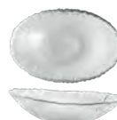
CUENCO OVALADO 22x14,5 cm Ref: 5428459 24/ M: 220x145 mm 6,70€