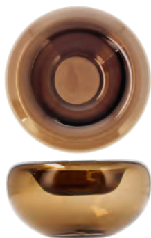
PLATO DEGUSTACIÓN 19,5x10 cm Ref: 5429572 4/ M: 195x100 mm 14,70€