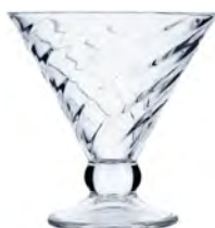
COPA HELADO CÓNICA 32 cl Ref: 5429308 24/ 1,60€