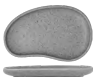
FUENTE 25,5x16 cm Ref: 5429558 16/ M: 255x160 mm 10,70€