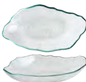
FUENTE OVAL 28x15,5 cm Ref: 5428703 16/ M: 280x155 mm 9,30€