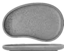
FUENTE 31x20,5 cm Ref: 5429559 16/ M: 220x145 mm 14,90€