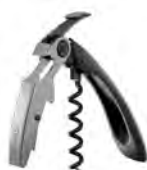
BIG TECH PREMIUM SACACORCHOS 12,8x18x3 cm Ref: 5428552 6/ 18,50€