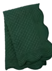
CAMINO DE MESA 50x160 cm Ref: 5428618 24/192 12,50€