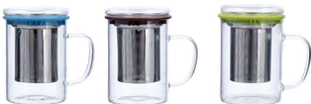
SERENIA TAZA INFUSIONES CON FILTRO INOX 35 cl Ref: 5428424 12/396 5,25€

Colección en borosilicato, ligero y resistente. Permite una preparación sencilla y rápida de tus té e infusiones. Además, el filtro de acero inoxidable garantiza una buena infusión sin residuos en la taza.