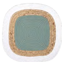
MANTEL INDIVIDUAL CUADRADO 38x38 cm Ref: 5428620 48/864 5,25€