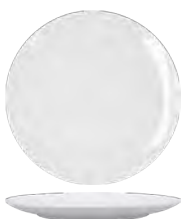
SELECT PLATO PIZZA 33 cm Ref: 5428055 12/432 M: Ø 330 mm 6,00€