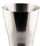
CUBITERA ACERO PLATA 5 L Ref: 5429217 6/ 66,50€