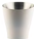
CUBITERA ACERO PLATA 5 L Ref: 5429222 6/ 67,60€