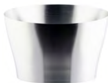
CUBITERA ACERO PLATA 20 L Ref: 5429221 3/ 107,10€