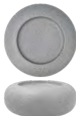
PLATO DEGUSTACIÓN 20,5x8 cm Ref: 5429557 8/ M: 205x80 mm 18,70€