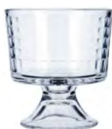
UMA COPA HELADO CUADRADA 30 cl Ref: 5429307 24/ 1,60€

Forma recta o cónica. ¿Cual es tu copa preferida para servir tus postres y helados?