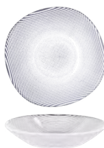
PLATILLO REDONDO 13x2,5 cm Ref: 5427475 36/2376 M: 130x25 mm 1,90€