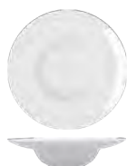
PLATO RISOTTO 26,5 cm Ref: 5428056 12/288 M: Ø 265 mm 4,40€