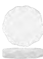
PLATAFORMA 20x4 cm Ref: 5429549 24/ M: 200x40 mm 11,50€