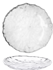
SELECT PLATILLO IRREGULAR 15,2x2,5 cm Ref: 5427474 36/1620 M: 152x25 mm 2,30€

Piezas que realzan cualquier plato o aperitivo, aportando un acabado elegante y profesional. Su transparencia permite que el alimento sea el protagonista. Ideales para servir aperitivos, salsas, postres y pequeños acompañamientos.