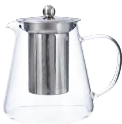
TETERA CON TAPA Y FILTRO INOX 55 cl Ref: 5428426 12/288 6,50€