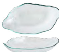
FUENTE OVAL 34x18 cm Ref: 5428704 4/ M: 340x180 mm 12,00€