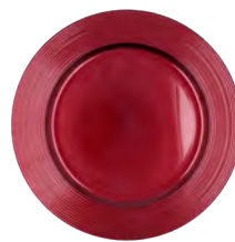
BAJO PLATO 33 cm Ref: 54281223 12/1080 1,65€