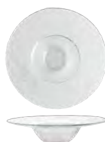
PLATO ALA 26 cm Ref: 5428457 6/ M: Ø 260 mm 6,80€