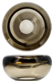
ORGANIKA PLATO DEGUSTACIÓN 15x7,5 cm Ref: 5429571 6/ M: 150x75 mm 11,00€