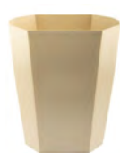
CUBITERA BAMBÚ 19x17x21 cm Ref: 5428546 10/ 14,50€