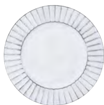
HABITAT BAJO PLATO 33 cm Ref: 5428118 12/1080 1,90€

Un toque decorativo para tus mesas. Polipropileno. No apto para uso alimentario.