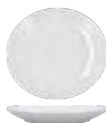
PLATO STEAK 28x26 cm Ref: 5428058 12/576 M: 280x260 mm 4,40€