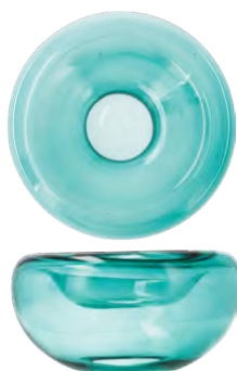
PLATO DEGUSTACIÓN 19,5x10 cm Ref: 5429573 4/ M: 195x100 mm 14,70€