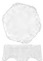
PEANA 20x7 cm Ref: 5429548 12/ M: 200x70 mm 12,50€