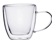
TAZA CAFÉ AMERICANO DOBLE PARED 15 cl Ref: 5427885 24/720 3,60€