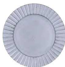
BAJO PLATO 33 cm Ref: 5428119 12/1080 1,90€