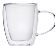
TAZA DOBLE PARED 30 cl Ref: 5427886 24/480 4,00€