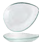
BOL BAJO 21x16,5 cm Ref: 5428705 24/ M: 210x165 mm 8,30€