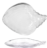
CARACOLA 15,4x11,5 cm Ref: 5427477 36/2160 M: 154x115 mm 2,00€