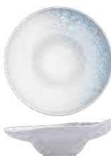
PLATO ALA ELEVADA 23x8 cm Ref: 5429566 12/ M: 230x80 mm 14,50€